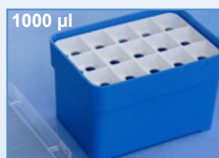
Kat.-Nr.: 974 290