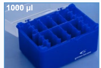
Kat.-Nr.: 941 320