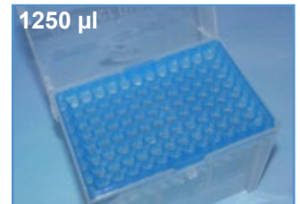
Kat.-Nr.: 970 350