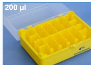
Kat.-Nr.: 941 310