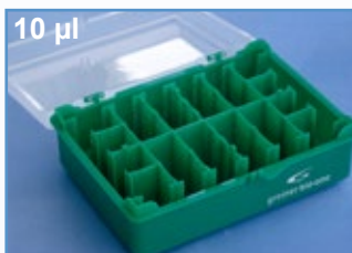
Kat.-Nr.: 941 300