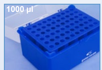
Kat.-Nr.: 941 325