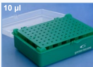
Kat.-Nr.: 941 305