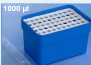
Kat.-Nr.: 974 280