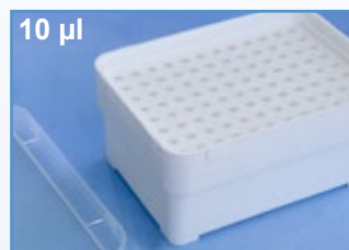
Kat.-Nr.: 973 276