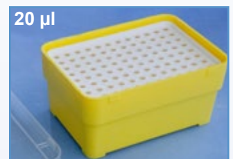
Kat.-Nr.: 973 272