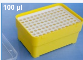
Kat.-Nr.: 973 202