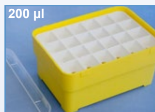
Kat.-Nr.: 973 270