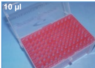
Kat.-Nr.: 970 310