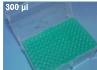
Kat.-Nr.: 970 330